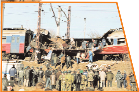
Подрыв электрички на участке Кисловодск — Минеральные Воды

вались в центре города Сдерот (Израиль), рядом с резиденцией Ариэля Шарона. Погиб трёхлетний ребёнок.