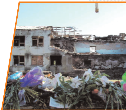
Школа №1 г. Беслана

Чудовищным актом терроризма стал захват заложников в школе № 1 города Беслана (Северная Осетия), совершённый боевиками 1—3 сентября 2004 года. В течение трёх дней террористы удерживали в здании школы 1128 человек —