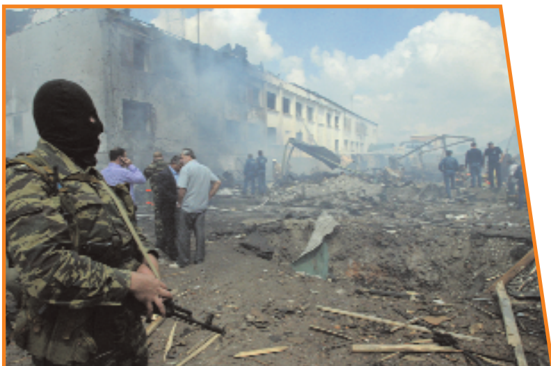
Терракт в г. Назрани

детей, их родителей и сотрудников школы. В результате погибли свыше 350 человек из числа заложников, мирных жителей и военнослужащих, из них более 180 детей. Свыше 500 человек были ранены, и среди них тоже множество детей. Терракт совершила террористическая группировка «Риядус Салихийн» (по-арабски — «Сады праведников») из состава террористической организации «Высший военный Маджлисуль Шура Объединённых сил моджахедов Кавказа». Скорбя о погибших и раненых, мы должны иметь в виду, что терроризмом было уже само покушение на личную неприкосновенность детей и их родителей и жестокое, бесчеловечное и унижающее их достоинство обращение. Людей под дулами автоматов загнали в спортзал, лишили возможности свободно передвигаться, их мучили жаждой — дети вынуждены были пить мочу — и запугивали убийством, а многих убили.