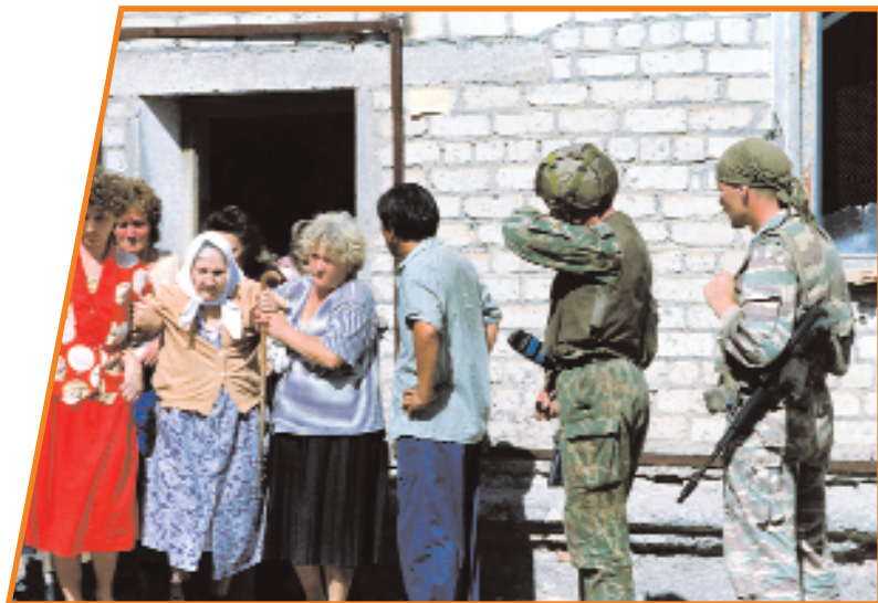
Освобождение заложников в г. Будёновске

были взяты в плен, убито более 40 заложников и мирных жителей. (Впоследствии Радуев был арестован, его судили и приговорили к пожизненному тюремному заключению. Он умер в тюрьме.)