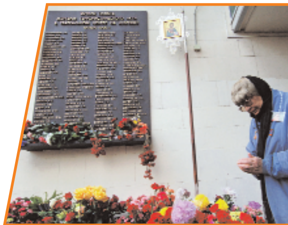
Мемориальная доска по погибшим на Дубровке

Террористам же право применять насилие общество не давало, т. е. не санкционировало его.