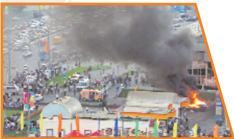
Взрыв у метро «Рижская» в Москве

В 1995 году банда Шамиля Басаева захватила здание горбольницы в Будённовске и взяла в заложники около 1600 человек, среди которых были дети, в том числе младенцы. Погибли 143 человека, ранены более 400 человек, среди убитых и раненых есть дети. (Позднее Басаев был ликвидирован.)