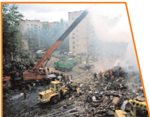
Взрыв жилого дома на Каширском шоссе в Москве

2000 год, Москва — самодельная бомба взорвалась в подземном переходе под Пушкинской площадью. Погибли 13 человек, ранены более 50 человек, среди них есть дети.