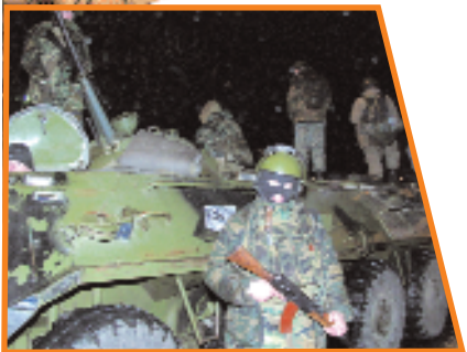
Внутренние войска МВД у здания Театрального центра на Дубровке

групп людей. Говоря иными словами, жертвами террористов может стать любой человек в любом месте и в любое время.