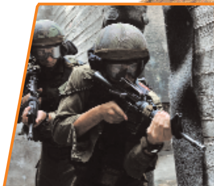
Действия спецподразделений вооружённых сил Израиля

Тот же, 2004 год — ракеты типа «Кассам» взор-