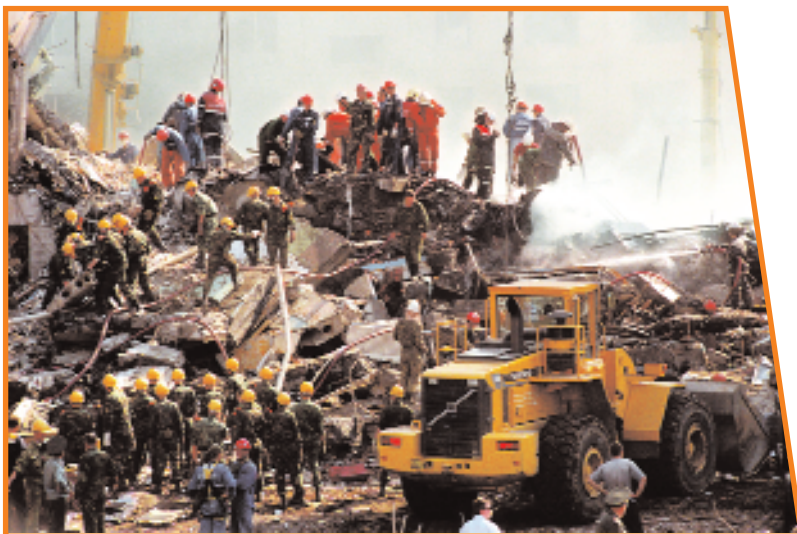
Разбор завалов после взрыва жилого дома на улице Гурьянова в Москве

Владикавказе. Погибли 16 человек, более 160 человек ранены, среди пострадавших есть дети.